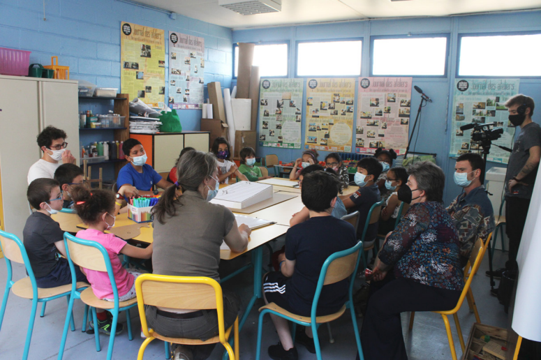
Dans la salle des apprenti.e.s architectes, partage du vécu de l'assemblée citoyenne du 29 mai, mercredi 2 juin 2021.

circuler en toute prudence et maintenir en toute sécurité ce travail magnifique” a-t-elle dit.